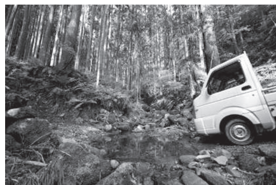
洗堰（洗い越し）：谷は直角に渡り、谷に向けて下がり越えてから上がる。水は道上を横断させる

伐開幅が狭いと林地減少も無く、さらに風・光・雨の流入を抑えることができ、風被害や土壌乾燥、道の