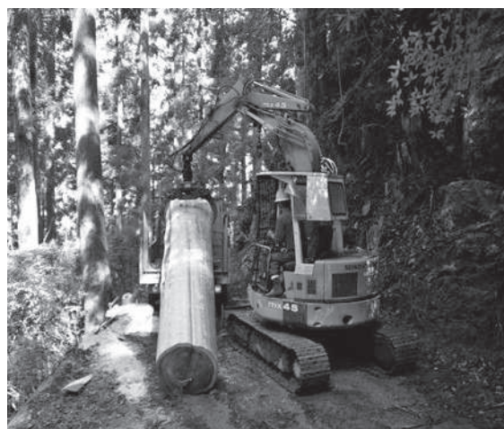
2.5m以下の作業道を使ってスギ200年生の大径材も十分搬出可能

私は以前、河川や砂防施設を自然に近い工法で設計する会社にいた経験から、予防砂防や予防治山の役割を果たしている何かがあるのではないかと直感した。その後、そういう視点で徳島と吉野の自伐林家の山林を調査した。そしてそれが何であるか判明した。彼らが所有山林を持続的に、また低コストで維持できるように長年考え抜いて形づくってきた「壊れない作業道」がそれだったのだ。