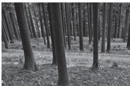
高密度路網：山の上からみると、道が重なって見える。道により山が階段状になり、水や土を止める

現在の林業の作業道の位置付けは「施業時に必要で、終了時に役目を終える」というもの。作業性を重視した施業時だけ使える一時的な作業道だ。25haの所有林を森林組合に間伐施業委託した友人がいる。施業時に作業道が敷設されたが、施業中から崩壊等が頻発。終了後は全く使えない状態となってしまったそう。土石流が起きて下流に迷惑をかけないかと毎年心配していた。この作業道は1m当たり1万2000円の高額補