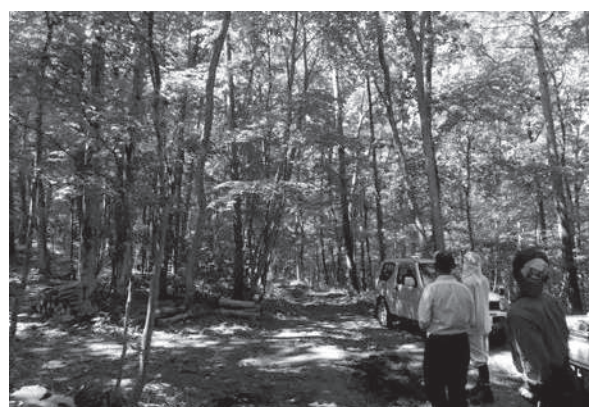
多間伐施業に挑戦中（作業道を敷設して間伐1回実施後）の岩手県九戸村の美しい広葉樹林。経済面も両立し、視察者が急増中

この東北展開により新たに注目されたのが「広葉樹施業」である。日本における広葉樹は「雑木」と軽視され、施業の対象とされてこなかった経緯がある。多間伐施業による自伐展開で広葉樹施業がどうなるか、東北と北海道でいち早く始めたメンバーに「作業道を敷設しながら2割以下の多間伐施業で試してみしてほしい」と