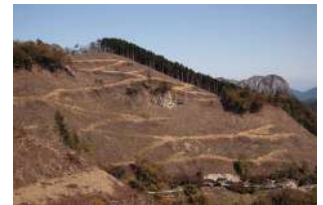
↑今後どっちの山になるかの分水嶺↓

B・C材生産中心の50年で終わる森林・林業にするのか、それとも今後長期にわたり持続的にA材中心に生産し続けられる森林・林業に移行できるか、どちらを選ぶかで未来の森の姿(良質な森か荒れた森か)や林業の姿(収入や生産する材等)が全く違ったものになります。